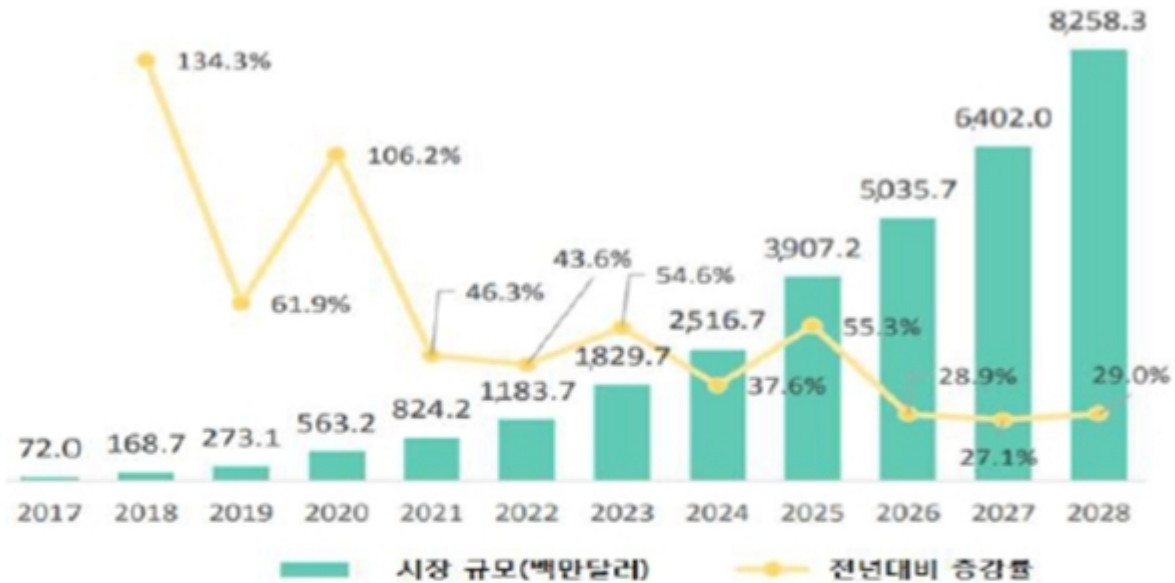
글로벌 car-t cell 치료제 시장현황 및 전망

글로벌 CAR-T 세포치료제 시장은 2017년 $72million 규모를 형성, 2017년부터 2023년까지 연평균 53.9%로 꾸준히 성장하여 2028년에는 $8.3billion 규모로 확대될 전망입니다. CAR-T 세포치료제 시장은 전세계 중 북아메리카가 가장 큰 지역으로 2017년 시장은 북아메리카가 유일합니다. 아시아 태평양은 2018년 북아메리카와 유럽에 이어 3번째이나, 가장 빠른 성장을(2019-2028년 CAGR 62.5%)로 향후 2028년에는 유럽 시장을 능가하여 북아메리카에 이어 2번째로 큰 시장규모를 형성할 것으로 전망됩니다